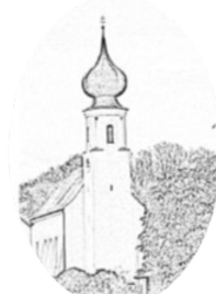
St. Ulrich Treidlkofen